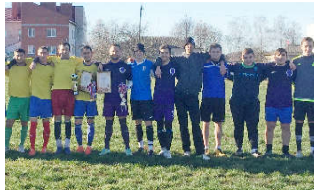
На фото команды участницы первенства.

И вновь в этом году кубок победителя по футболу получила команда «Спутник» с. Вязовна. Молодцы! Они являются неоднократными победителями этого соревнования. Команда дружная и сплоченная!