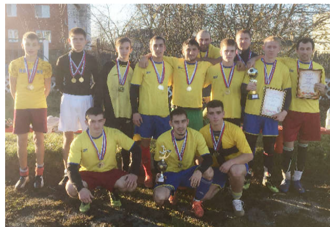
На фото команда «Спутник» – чемпионы первенства района и обладатели Кубка главы администрации района по футболу.

Занимайтесь спортом! Больше проводите времени со своей семьей на свежем воздухе!